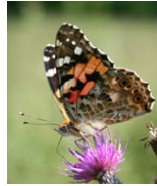
Belle dame Visuel 1 : Frédéric Degrave